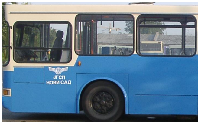
Сл. 3 Оквирни приказ захтеваног лакирања