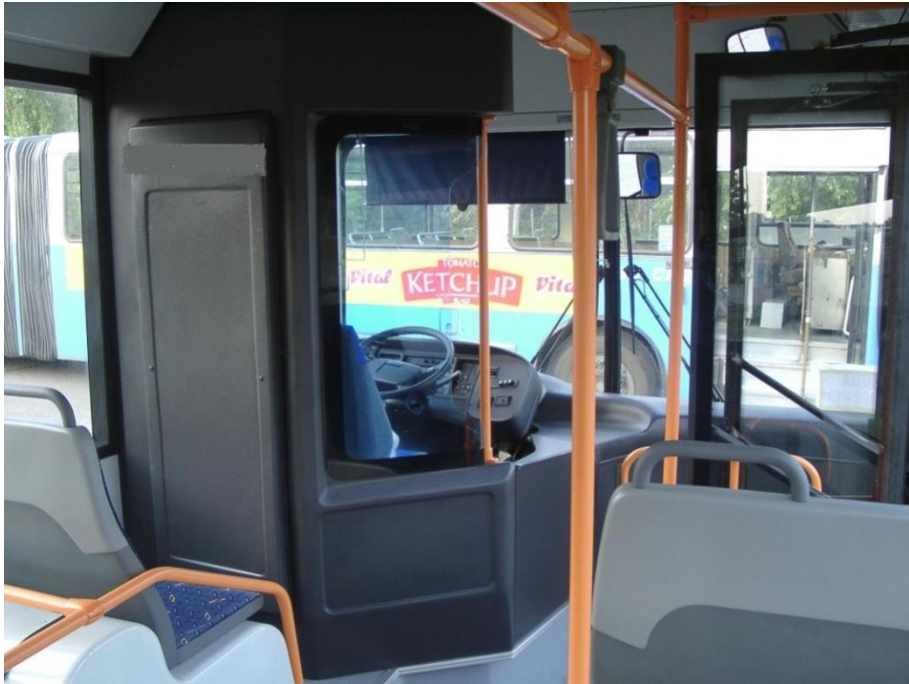
Сл. 1 Пример захтеване возачке кабине

Брава за отварање/затварање врата и забрављивање у затвореном положају треба да се налази са унутрашње стране врата - до возача.